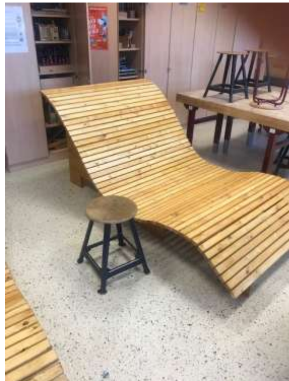
Sonnenliege, gebaut von der Schülerfirma „BOSS Holz“