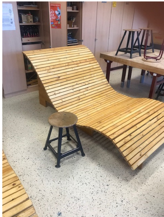
Sonnenliege, gebaut von der Schülerfirma „BOSS Holz“